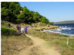
St Mitre les Remparts