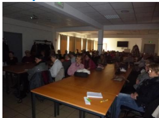
Conférence « Modigliani et Soutine : une amitié »