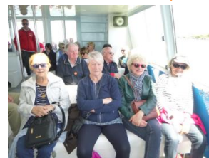
Une balade en bateau...

Et, oui vous pouvez faire le compte : c'est deux visites par mois qui nous sont offertes et... sans trop se ruiner car pour deux visites mensuelles avec chacune une visite guidée le matin et une l'après-midi nous avons déboursé seulement 25 € (pour les deux sorties !).