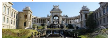
Palais Longchamp – Marseille