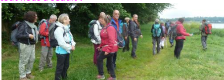
sur les berges de l'Elorn.

*SEJOUR RANDO BRETAGNE (8j, 7 nuits) Un peu de pluie, mais une seule rando a été annulée, les autres assez ensoleillées ! Plougastel le pays des fraises, l'île d'Ouessant, la presqu'île de Crozon, Perros Guirec et sa côte de granit Rose, la baie de Morlaix... Les marées, les coquillages, les fleurs : tout nous a séduit !