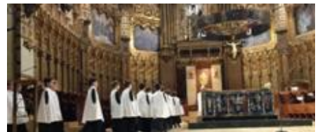
La manecanterie de Montserrat

Faire ses valises, prévoir une parenthèse, se retrouver pour vivre de belles aventures ensemble... Nous sommes toujours partant pour ces séjours qui laissent des souvenirs inoubliables, des moments particuliers et... si quelquefois tout n'est pas parfait, ou, une petite anicroche s'imisce, tout cela est vite oublié car « tournent et tournent dans nos têtes toutes les images de nos belles balades !... »