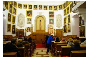
Dans la Faculté de Médecine à Montpellier

Sainte Baume et une halte à Ollières sous un splendide soleil.