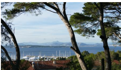
L'île de Porquerolles

tembre avec Arles et une belle exposition : « Soleil Chaud, Soleil tardif », qui s'est inscrite dans le cadre « Picasso-Méditerranée » pour se poursuivre par l'exposition initiatique à l'univers de Paul Nash . Mais qui a été choqué par l'exposition « THE GREAT EXHIBITION » qui est une rétrospective des œuvres de Gilbert & George ? Dans tous les cas celle-ci nous a bien interpellés car nous en parlons encore ! En Octobre nous nous sommes rendus à Aigues-Mortes pour la visite des Salins qui a été impossible à cause de l'orage qui nous avait précédé. On ne s'est pas laissé démoraliser car aussitôt nous voici embarqué pour une balade bateau idéale sur les canaux : personne n'a regretté la modification du programme ! D'autant que la journée s'est prolongée avec une visite guidée de la ville et des Remparts ! Quinze jours plus tard nous nous sommes rendus à Perpignan pour la visite de la belle exposition sur Raoul Dufy et la visite du Château de Salses . Que nous a réservé le mois de novembre ? Vous rappelez-vous de cette jolie journée ensoleillée au Thor et à l'Isle sur la Sorgue et... puis quelques temps plus tard ce beau voyage que notre escale sur l'île de Porquerolles .