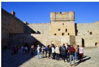
La forteresse de Salses (66)

En Décembre nous avons découvert le nouveau musée de la Romanité à Nîmes , mais nous avons aussi prolongé par une visite insolite de la ville . La première sortie de l'année était à Avignon , il faisait doux pour une autre visite insolite, d'Avignon cette fois-ci, et pour la visite du musée Vouland ... De belles découvertes qui nous charment encore ! Mais la seconde visite du mois a été exceptionnelle : nous avons découvert tous les recoins de l'Opéra Comédie avec des « passionnés » et bien plongés dans l'histoire de la Médecine . Vous l'avez compris, nous étions à Montpellier .